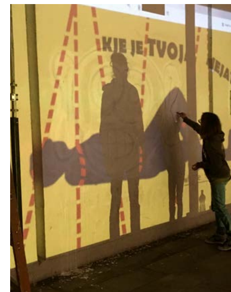
V delavnici Mapiranje meja so študentje iz Beograda, Krakova, Budimpešte, Reke in Nove Gorice preizpraševali tako svoje kot tudi družbene in specifične lokalne meje med Slovenijo in Italijo v obeh Goricah.