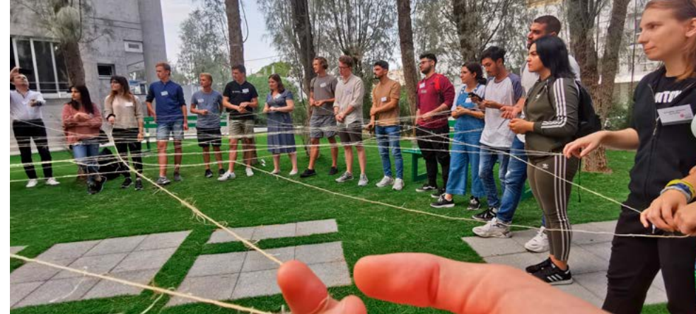
Uvod v mednarodno delavnico EmindS na Cipru, kjer so študentje iz Nove Gorice združili moči s kolegi drugih smeri iz avstrijskega Gradca, finskih Helsinkov, grškega Soluna in ciprske Nicosie.

V sklopu vertikalne programov, triletnega Digitalne umetnosti in prakse (1. stopnja) ter dvoletnega magistrskega Medijske umetnosti in prakse (2. stopnja) , študentje krožijo v okoljih in nosilnih modulih animacije, fotografije, (video) filma, novih medijev, scenografskih prostorov in sodobnih umetniških praks , v programu druge stopnje se gibljejo tudi med partnerskimi univerzami med Gorico, Reko, Gradcem, Budimpešto in drugimi.