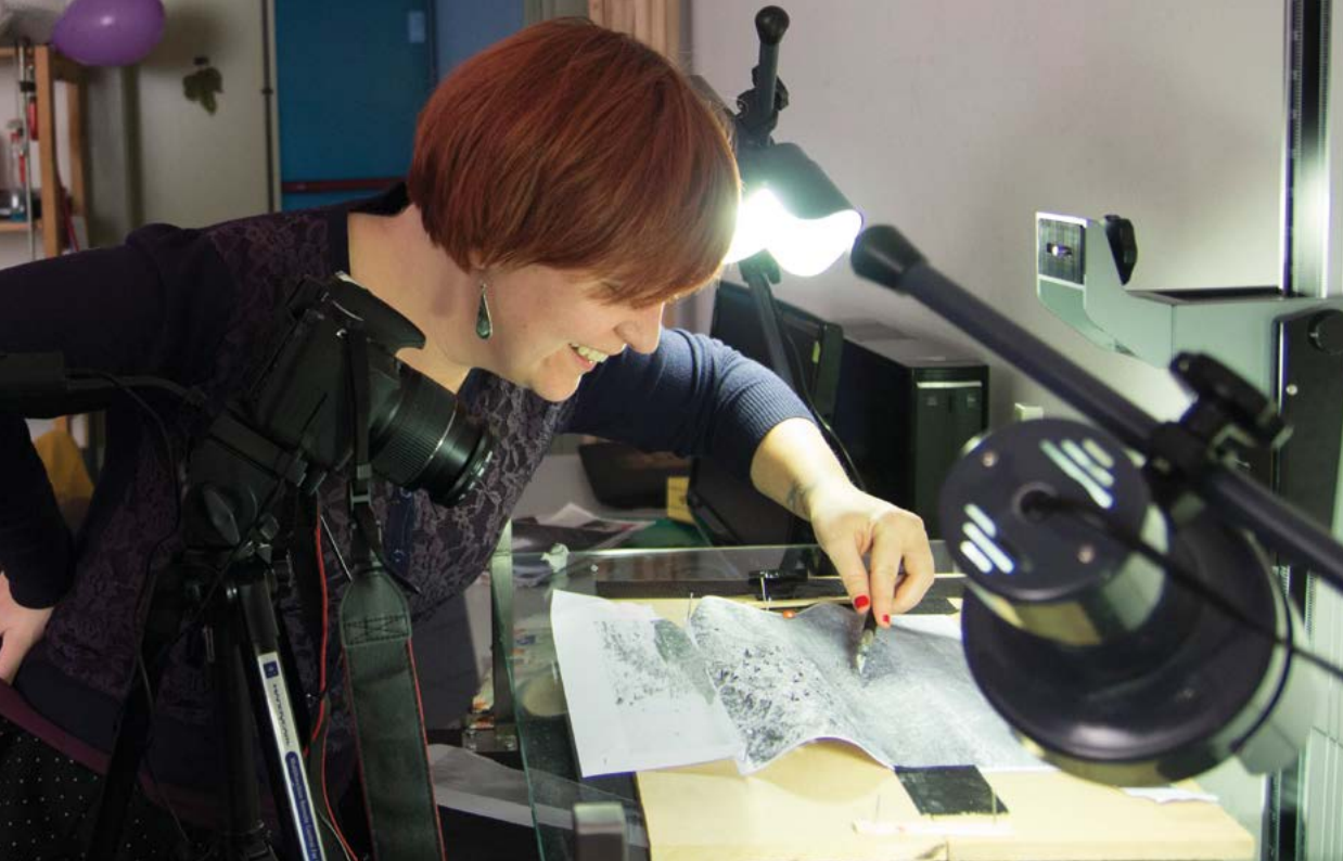
Snemanje stop-motion delavnice pod mentorskim vodstvom gosta – britanskega mojstra animacije Paula Busha.