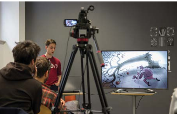
Študentje predstavljajo svoje diplomske oz. magistrske projekte svojim kolegom in mentorjem v različnih produkcijskih fazah.

Študenta cenimo kot samostojno in kreativno osebnost, ki se razvija v skupini in skupnosti. Z inovativnimi pristopi in pedagoških, raziskovalnih in tudi produkcijskih procesih spodbujamo samostojno kreativno in akademsko delo študentov, ki jih vodi odprta skupina strokovnih sodelavcev. Mentorje in goste izbiramo skrbno, odločata tako njihova odličnost v sodobni praksi kot tudi akademska prepoznavnost. Na spletni strani //au.ung.si/solamo/ljudje lahko podrobneje spoznate vpletene učitelje. To zagotavlja visoko kakovost in aktualnost znanj in veščin, ki jih posredujemo študentom. Projektno delo in produkcijsko povezovanje v zunajšolskih in tudi mednarodnih okoljih študentu